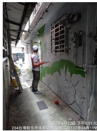
2022年4月22日 下午5:01:02 234台灣新北市永和區保福路二段133巷64弄10號