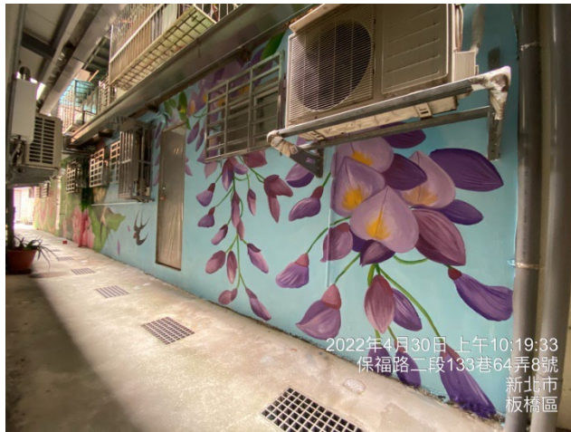
2022年4月30日 上午10:19:33 保福路二段133巷64弄8號 新北市 板橋區