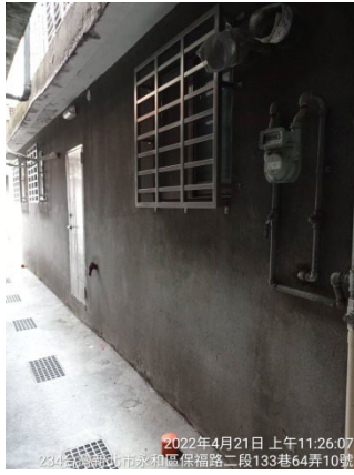
2022年4月21日 上午11:26:07 234台灣新北市永和區保福路二段133巷64弄10號