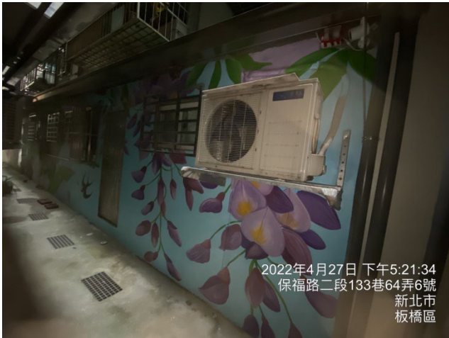
2022年4月27日 下午5:21:34 保福路二段133巷64弄6號 新北市 板橋區