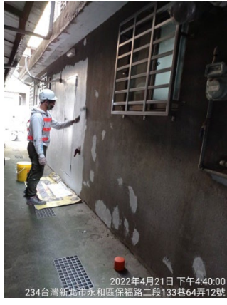
2022年4月21日 下午4:40:00 234台灣新北市永和區保福路二段133巷64弄12號