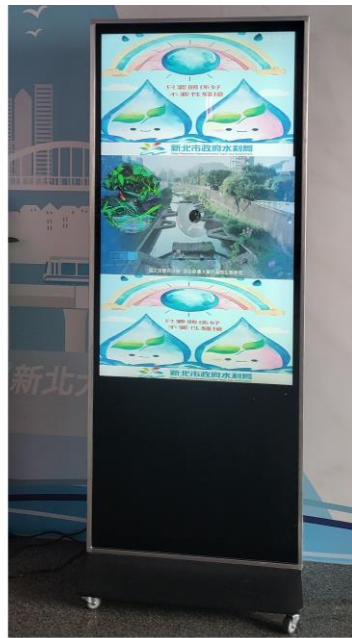
29樓東側電梯口電子看板