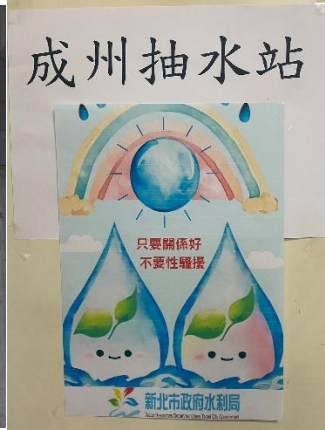
貴子坑溪河川營造計畫-泰山工務所 二重疏洪道左岸加高工程-五股區工務所 成洲抽水站