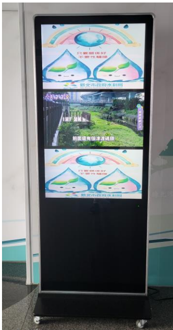
29樓西側電梯口電子看板