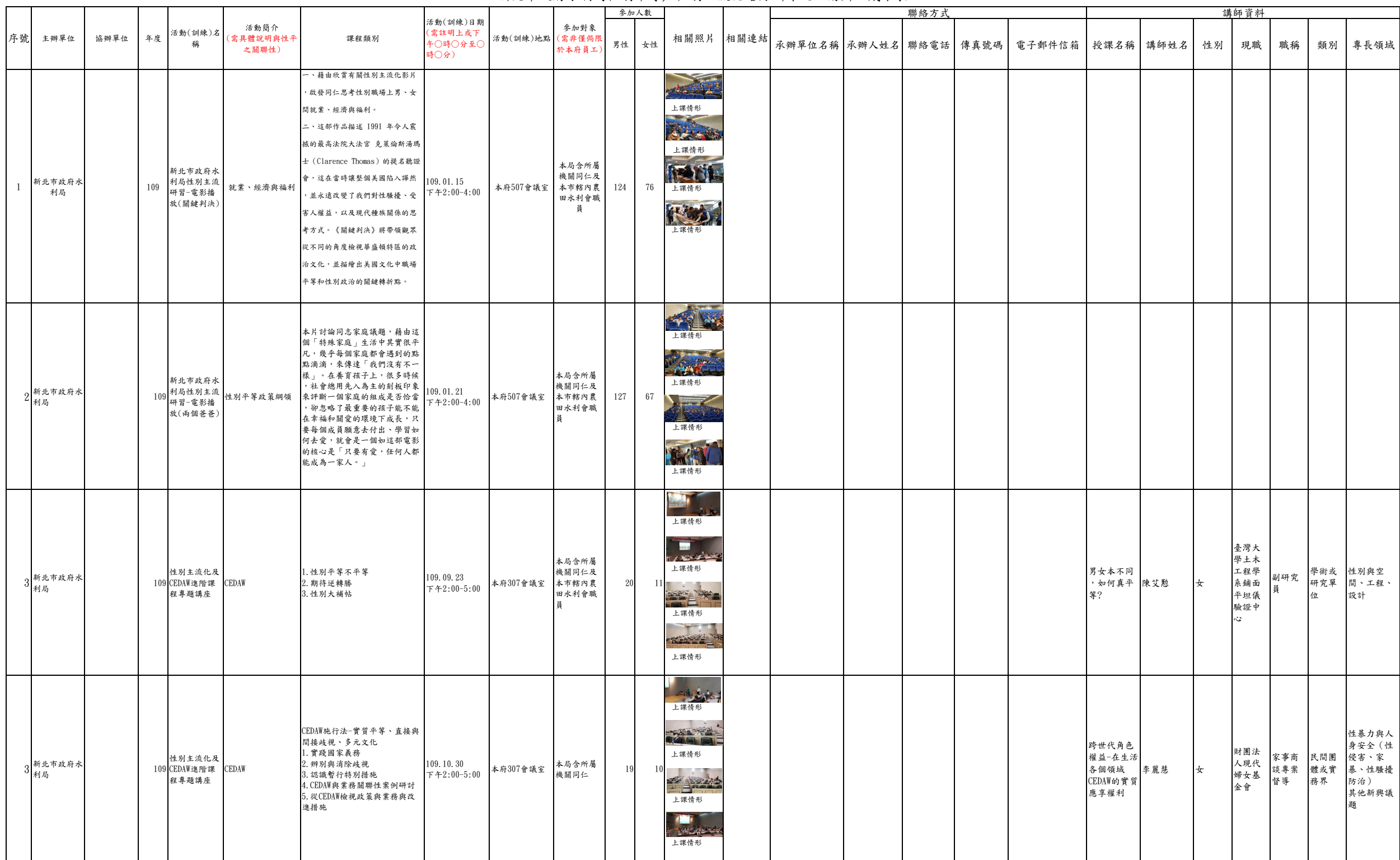
新北市政府水利局性別平等／性別主流化培力訓練及活動辦理成果表