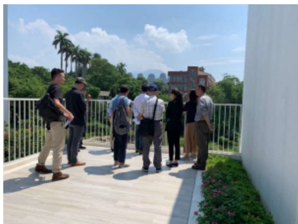
「淡水第二漁港水環境改善計畫」會勘照片