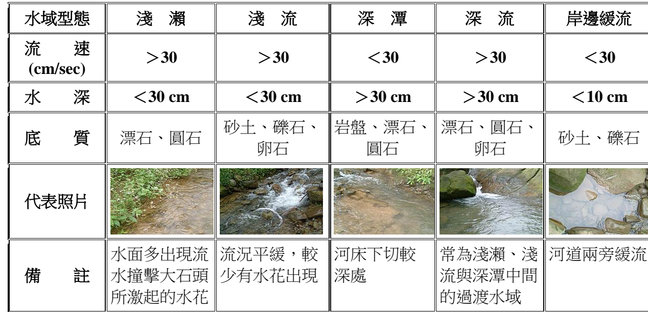
表 A-1 水域型態分類標準表