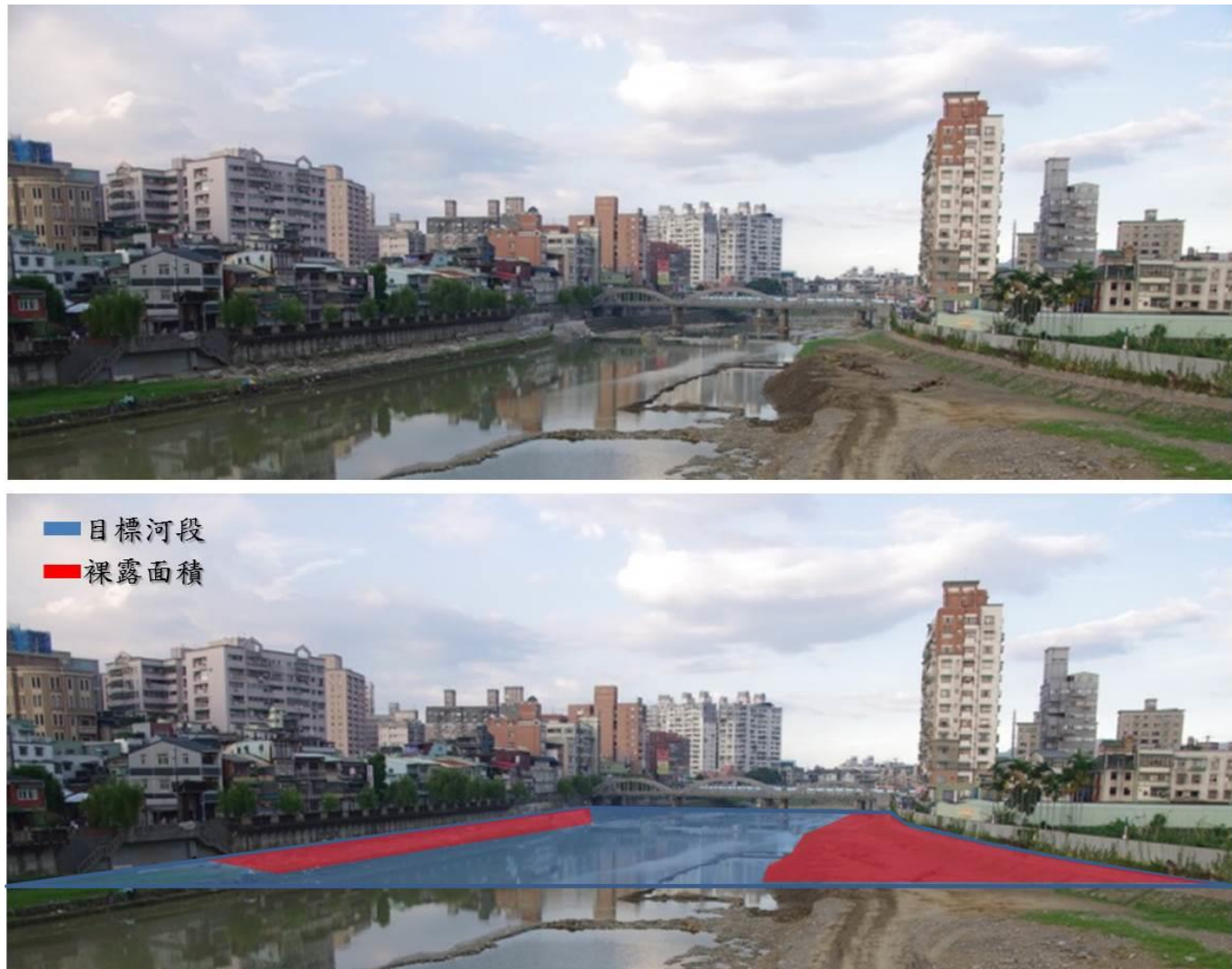
圖 D-1 裸露面積示意圖