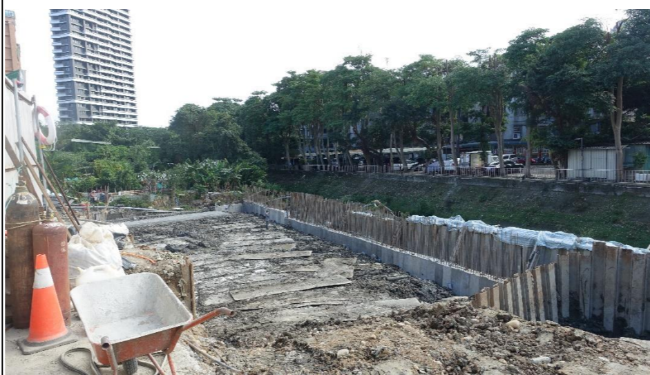
工程設施及下游水岸護坡