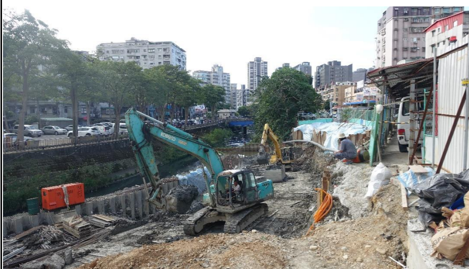
工程設施及上游水岸護坡