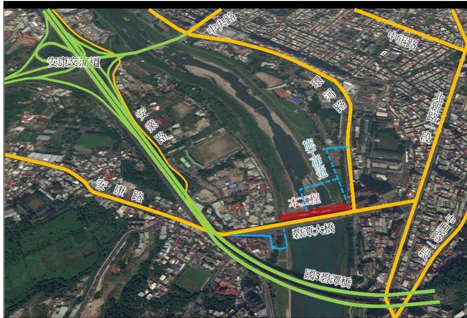
圖三、施工擾動範圍

本案施工主要為壩體周遭，其他部份無較大擾動，另一為施工便道造成下游棲地破壞干擾，如圖三所示，為工程主要擾動區域。