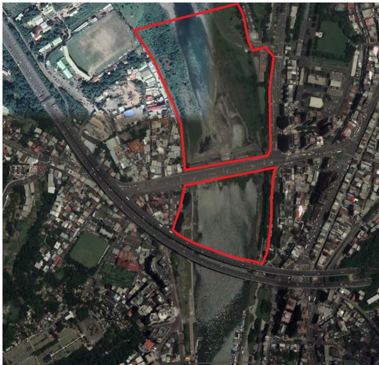
圖二、生態關注區位圖

建議之生態關注區為圖如圖所示，考量本區物種無特殊保育類物種，建議大部份均為中度敏感區域，附近次生林帶與低灘地區域，建議加強注意，相關關注動植物種請參見表一，為特別重要之生態保全對象。