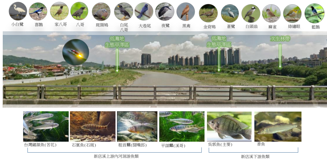
圖一、自然與生態環境說明圖

水域生態資源因新店溪碧潭堰上游環境未受大規模破壞，有多種原生淡水魚，如：粗首鱨、台灣石鱨(台灣特有種)及明潭吻蝦虎…等，新店溪碧潭堰下游以吳郭魚為大宗，其他蝦蟹螺貝類及水生昆蟲尚無發現任何稀特有及保育類物種。總體而言，碧潭堰下游區域，河岸兩側低灘地生態草澤區腹地廣大，並與住宅區有次生林帶緩衝，因此孕育許多水域及鳥類棲息，吸引許多人來此釣魚及賞鳥，並水岸夏季也有螢火蟲出沒，自然生態豐富度高，如圖一所示，相關生態調查彙整成果如表一所示。