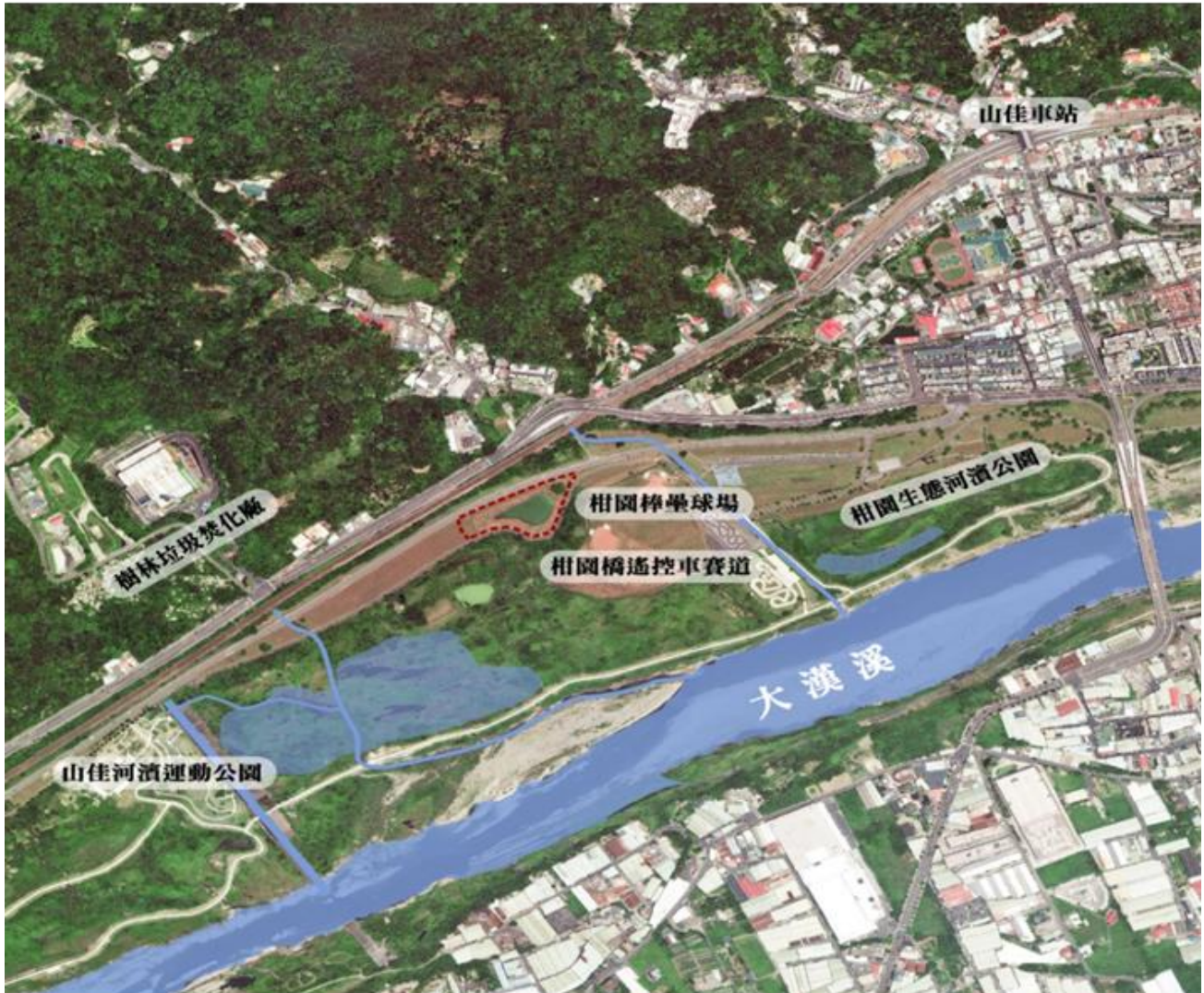
圖二 樹林區柑園河濱公園水環境再造範圍位置示意圖

工區範圍：本案位於大漢溪左岸之柑園河濱公園內，距離山佳火車站約1公里，鄰接樹林環保河濱公園棒球场並鄰接館前路，評估範圍面積約5,000平方公尺，內有一滯洪池、大榕樹、樹下休憩平台與座椅。