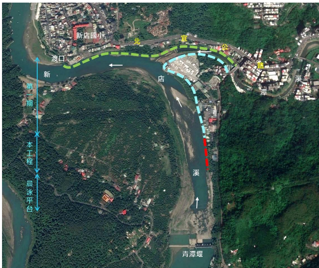
圖1 碧潭堰上游至烏來沿線亮點營造工程(第2標延伸段)

本案計畫範圍在新店溪青潭堰下游右側，為已完工之碧潭堰上游至烏來沿線亮點營造工程(第1期)之第2標延伸200公尺至晨泳平台，相關位置詳圖1所示。