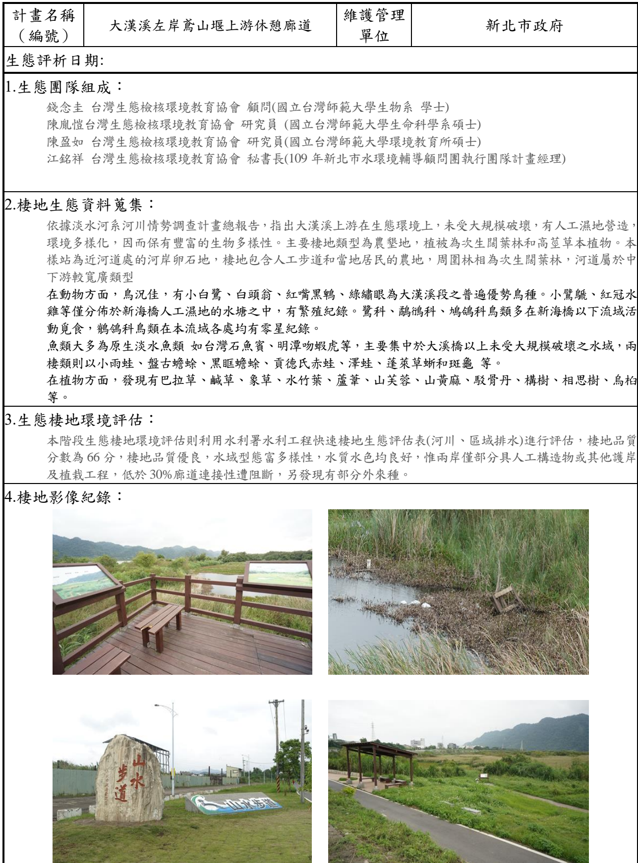
附表 M-01 工程生態評析