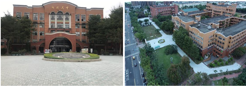
新北市三重區新北高中透水保水工程