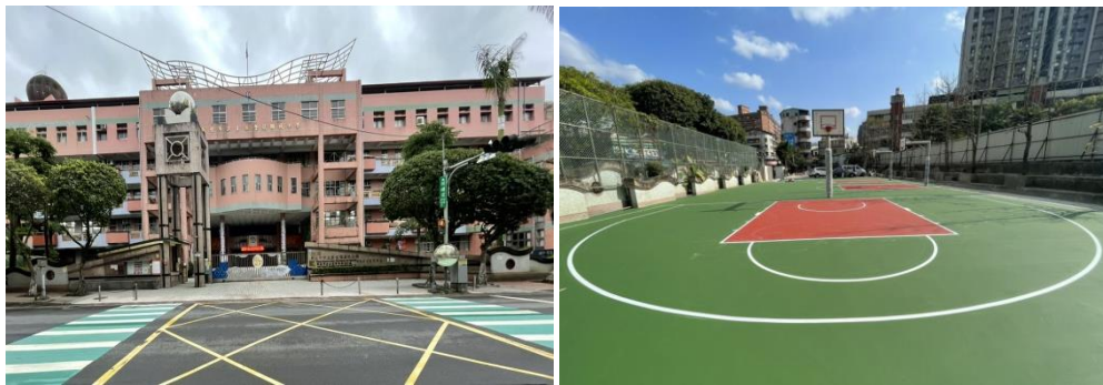
新北市汐止區金龍國小透水保水工程