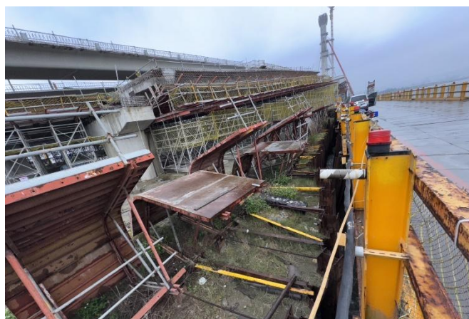
圖二 淡江大橋及其連絡道路 5K+000~7K+035 新建工程