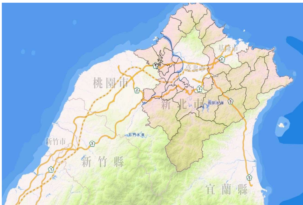
圖一 新北市地理位置圖

本市 113 年底計有 404 萬 6,564 人，其中女性人口 208 萬 1,497 人、男性人口 196 萬 5,067 人，總共有 1,032 里，共計 172 萬 1,085 戶。