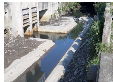
新北市蘆洲區水湳溝排水整治工程