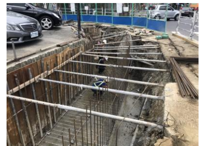
新北市五股區成泰路一段 101 及 175 號 周邊排水改善工程