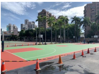
新北市三重高中透水保水工程