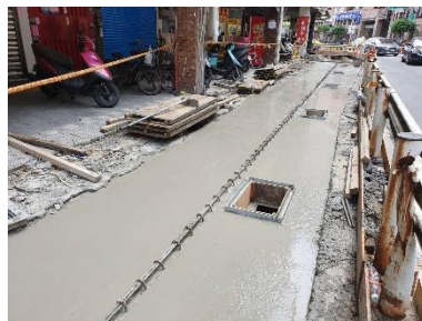
新北市永和區 FG 雨水下水道幹線 第二期新建工程