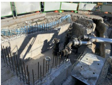
板橋區文化路一段及民權路口 雨水管涵改善工程