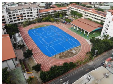
北市五股區成州國小透水保水工程